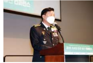
해경 차세대 함정 발전 컨퍼런스 장비와 기술변화에 적극 대응하고, 국가정책에 부응하는 국민참여 플랫폼을 마련하기 위한 함정 선진화 및 기술능력을 확보를 목표로 합니다.