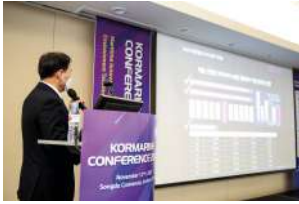
2020 기준: KORMARINE Conference '코마린 컨퍼런스'는 조선해양산업이 최근 맞닥뜨린 위기 극복 방안을 논의하는 장 이자 산업 발전을 위한 기회의 장입니다.