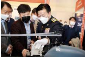
해경장비도입상담반과의 구매상담 기회 제공 국내 외 해양경찰 및 바이어와의 전문 수출상담