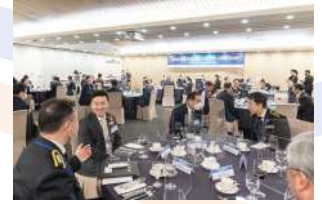
참가업체 초청 네트워킹 만찬